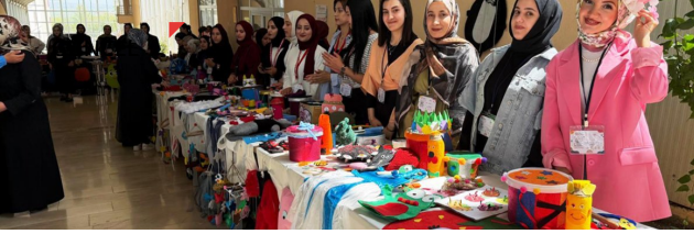
GELECEĞİN EĞİTİMCİLERİNDEN YARATICI DOKUNUŞLAR: ÇOCUK GELİŞİMİ PROGRAMI'NDAN