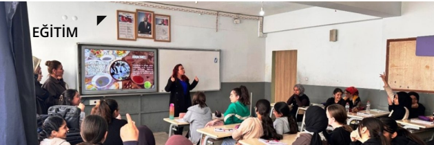
GELECEĞİN YILDIZLARI MESLEKİ EĞİTİMLE PARLIYOR: MUŞ'TA KIZ ÖĞRENCİLERE KARIYER