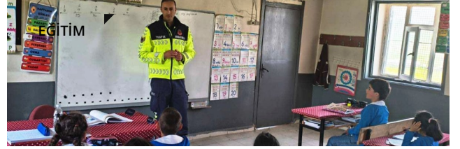
JANDARMADAN MİNİK KALPLERE HAYATİ DOKUNUŞ: BULANIK'TA TRAFİK DEDEKTİFLERİ İŞ